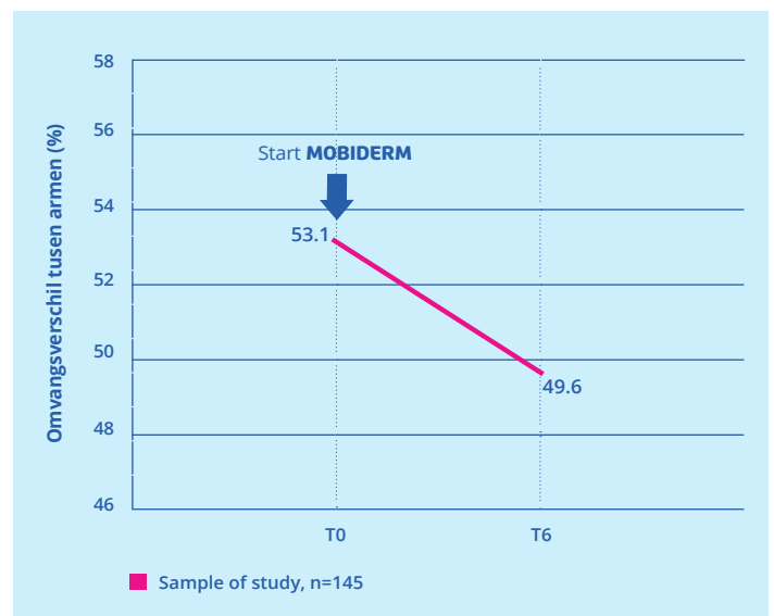
Omvangsverschil armen na start Mobiderm (n=145)

Deze studie heeft de grootste populatie en de langste onderzoeksperiode binnen studies naar compressiehulpmiddelen gedurende de nacht. De primaire uitkomstmaat is het verschil in omtrek tussen aangedane en gezonde arm.